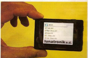
Најновији дигитални видео-рекордер

Детективске агенције почеле су да се отварају почетком деведесетих и базиле су се упузом на платном дукату. Сада је другачије. Основно делатност им је проналажење несталних лица или предметно, провера бонитета и солвентно-