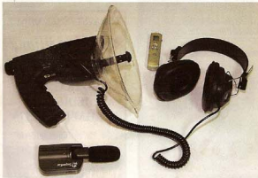
Уређај за дискретивноње